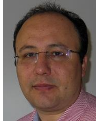
Superintendencia de Seguros Privados (SUSEP), Brésil

Directrice de Communication et des Affaires Internationales, ACAPS